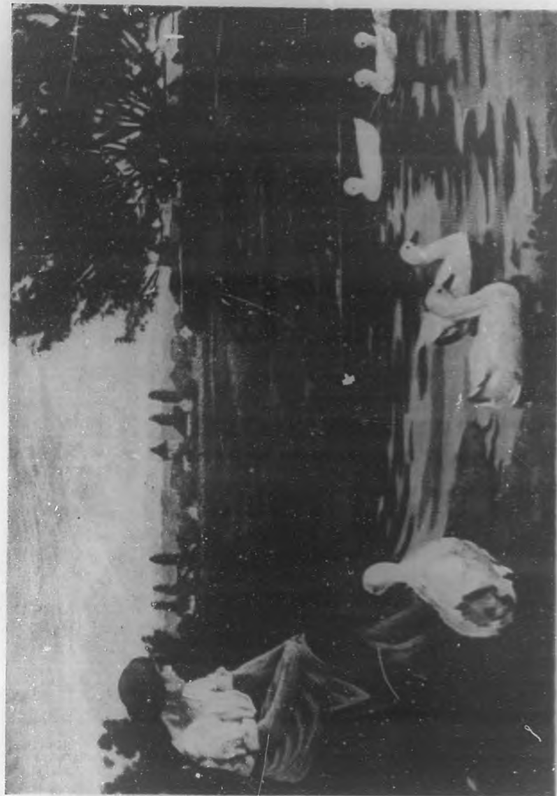
(Grabado titulado de BOHEMIA.)