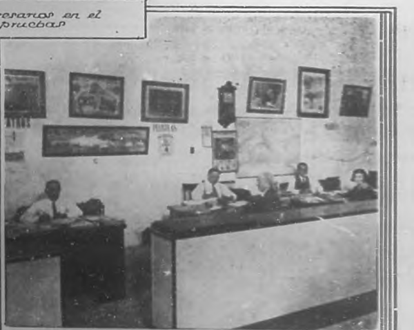
Oficina destinada a la selección y marca de programas.