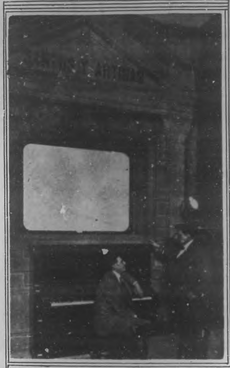
Los populares empresarios en el Salón de pruebas

Por las fotografías que publicamos en esta página podrá darse cuenta el lector de la magnitud del nuevo y gallardo esfuerzo realizado por los