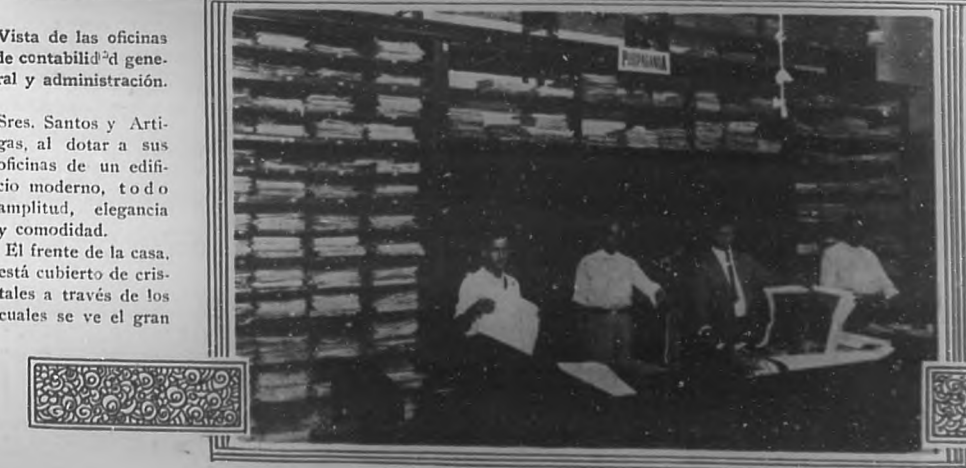
Departamento de propaganda, carteles y litografías.

flagración o deterioro. BOHEMIA felicita efusivamente a tan simpáticos empresarios por el éxito inmenso que significa el que hayan podido instalar sus oficinas en casa propia.