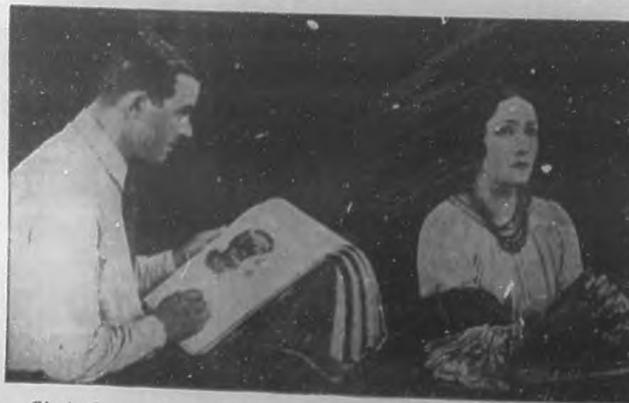
Gloria Swanson, estrella de la "Paramount Pictures", en una "pose" para su última magistral producción "Wages of Virtue".

Señorita Lulú:—Siga soñando con la pálida libélula de ese imposible; allá en la soledad piadosa de su humilde aldea, forje bellas y santuosos palacios de ensueños. Cuando el sol, como una hostia de oro, cuelgue sobre las ramas de los árboles de su huerto sus primeros ósculos y quiebre sus rayos en los aljofares que la noche ha regado sobre ellas; cuando la tarde, como un gran lirio enfermo de anemia, caiga lentamente, silenciosamente; cuando el mar bravo rompa el cansancio de sus olas co-