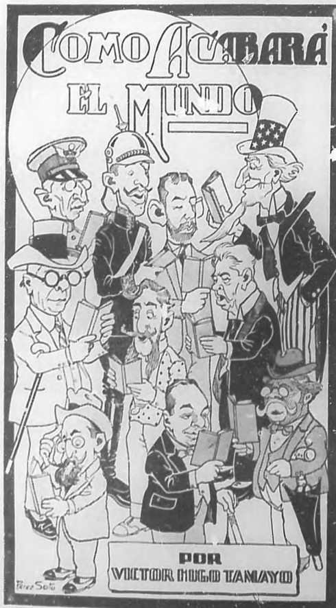
Portada del nuevo libro de Victor Hugo Tamayo "Cómo acabará el mundo", dibujo del notable artista mexicano A. Pérez Soto.

Para terminar, remarquemos que ha sido en los talleres de esta Revista donde se ha conccionado el nuevo libro de Tamayo, que forma un elegante y bien impreso tomo en octavo mayor.